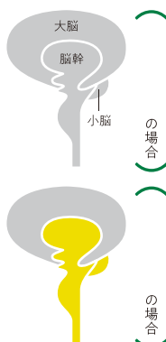
働かなくなった部分